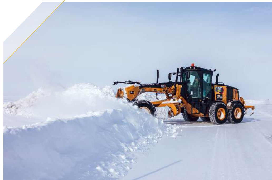
Строительство и содержание автозимников