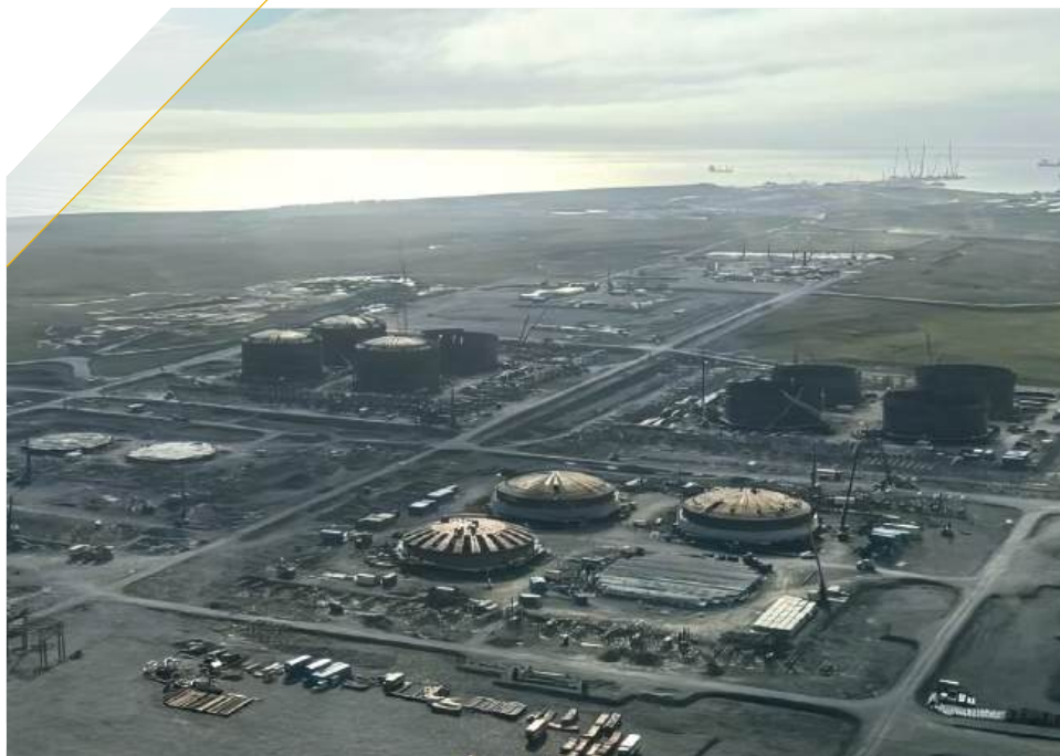
Инженерная подготовка приемо-сдаточного пункта