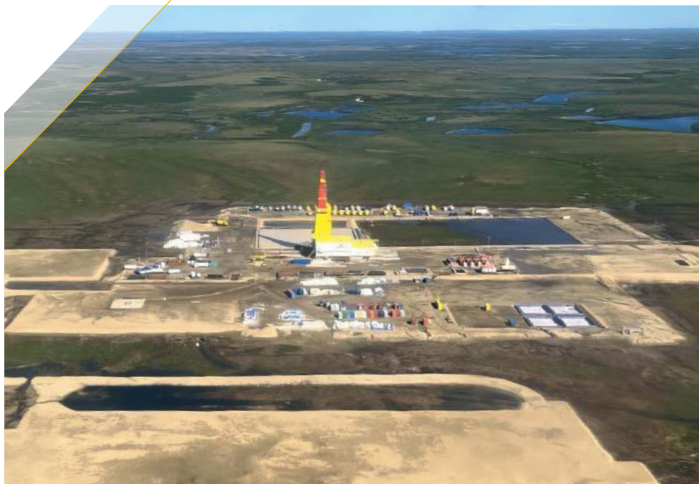
Инженерная подготовка кустовых площадок