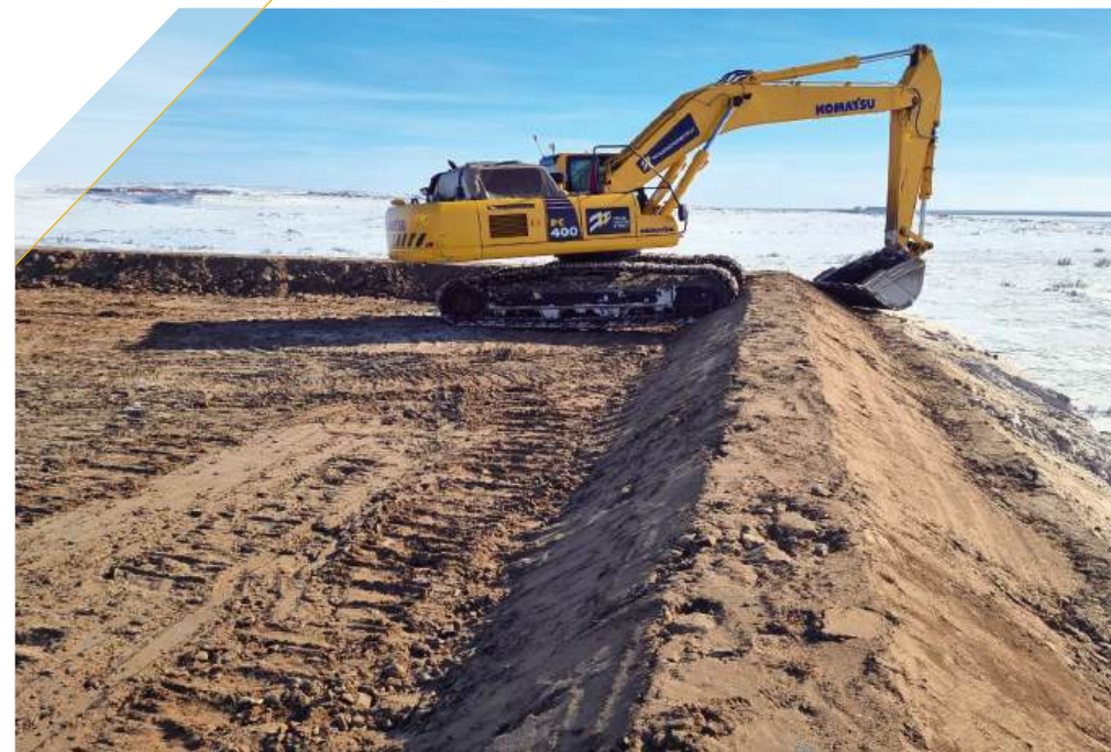
Инженерная подготовка полевых складов горючего