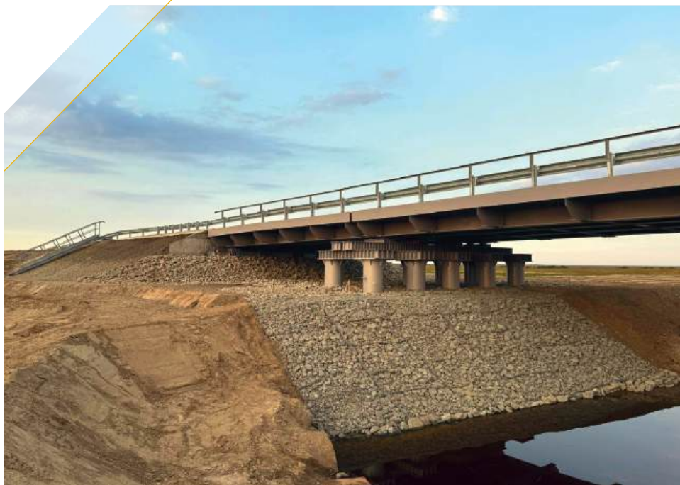
Мост через реку Лагтяха