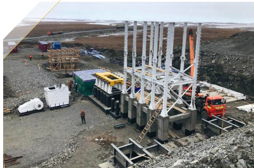
Строительство и монтаж дробильно-сортировочного комплекса